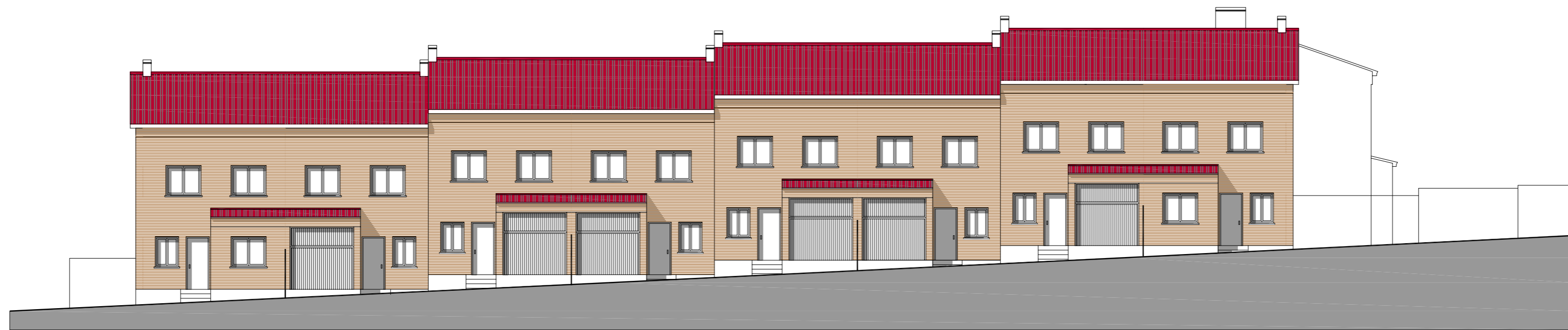
ALZADO TRAVESÍA DE PALOMAREJOS