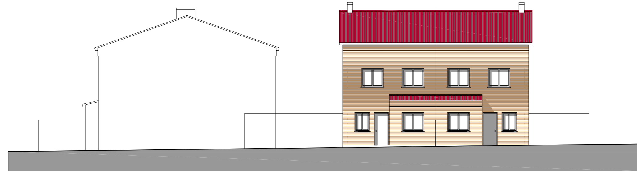
ALZADO CAMINO DE TORRECABALLEROS